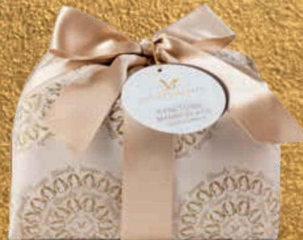
PROPOSTA 7M Panettone mandorlato senza canditi - kg 1