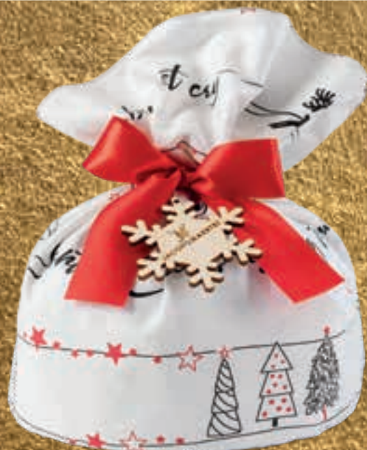
PROPOSTA 7F Panettone classico Deluxe - kg 1