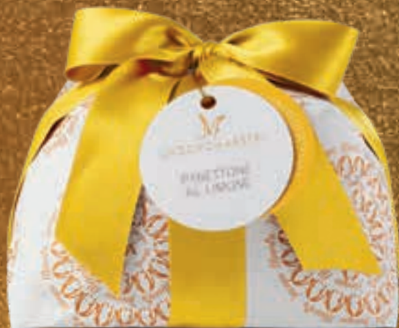
PROPOSTA 7I Panettone al limone - kg 1