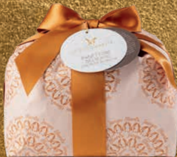
PROPOSTA 7L Panettone delicato con pezzi di frutta - kg 1