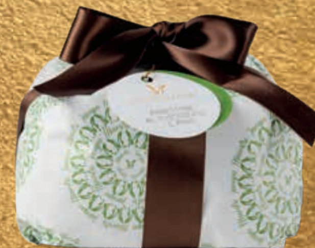
PROPOSTA 7N Panettone al cioccolato e pera - kg 1