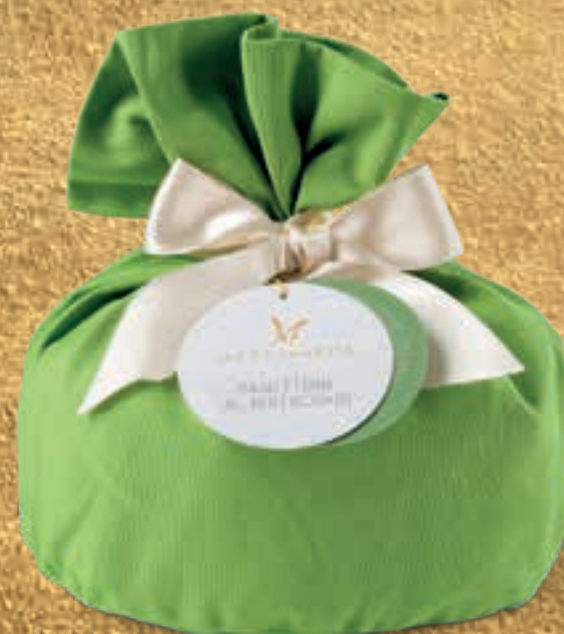
PROPOSTA 7G Panettone al pistacchio - kg 1